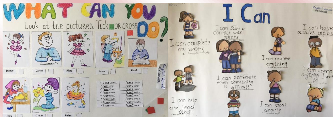
Малюнок 1 Постери I can

Студенти коледжу творчо опрацьовують отримані знання на академічних заняттях з англійської мови, методик викладання, під час тренінгів та конференцій з формування характеру та підтримки інклюзивної освітньої спільноти. Ілюстрація до кейсу – студентські навчальні постери з вивчення граматики англійської мови, які окрім інструктивної функції, мають ціннісний, естетичний, виховний та розвиваючий потенціал. Постери диджиталізовані, до них розроблені інтерактивні завдання, зняті відео-інструкції та розміщені в мережі Інтернет, яка є природнім габітатом покоління Z.